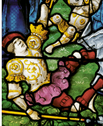
Châlons-en-Champagne, église Notre-Dame-en-Vaux, Les funérailles de la Vierge (détail), Mathieu Bléville 1526