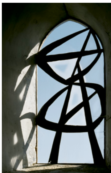
Fossé, église Saint-Nicolas, Pierre Székely, 1955