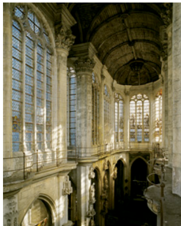
Troyes, église Saint-Pantaléon, XVIIe siècle