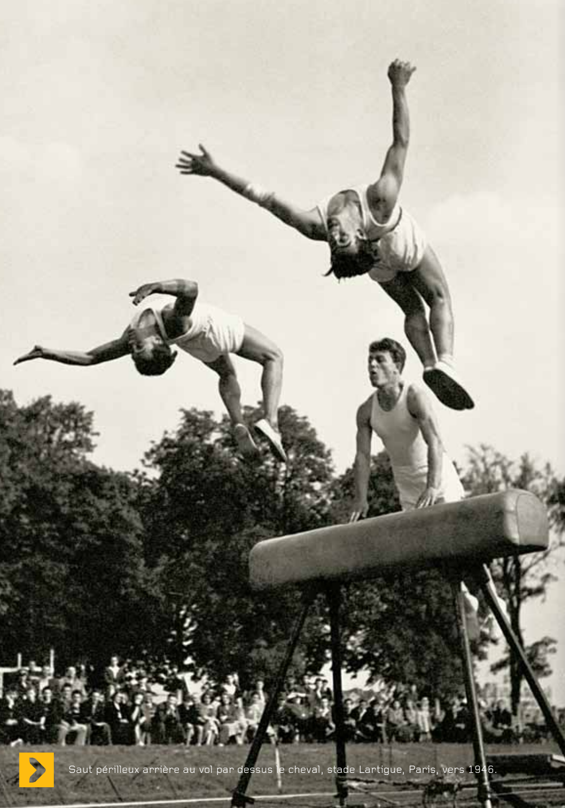
Saut périlleux arrière au vol par dessus le cheval, stade Lantigue, Paris, vers 1946.

Même si étymologiquement le mot « sport » vient d'un vieux vocable français, « desport », qui signifiait au Moyen Âge « se divertir, s'amuser », le sport moderne en tant qu'activité compétitive a vu le jour en Angleterre dès le premier tiers du XIX e siècle. Ce n'est qu'autour des années 1900 que cette nouvelle activité arrive en France, sous l'impulsion notamment du baron Pierre de Coubertin. Fortement marqué par l'éducation que dispensent les Public Schools , des écoles privées anglaises qui font du sport une matière obligatoire dans la formation des futures élites de la nation, il va œuvrer pour installer durablement le sport dans l'hexagone.