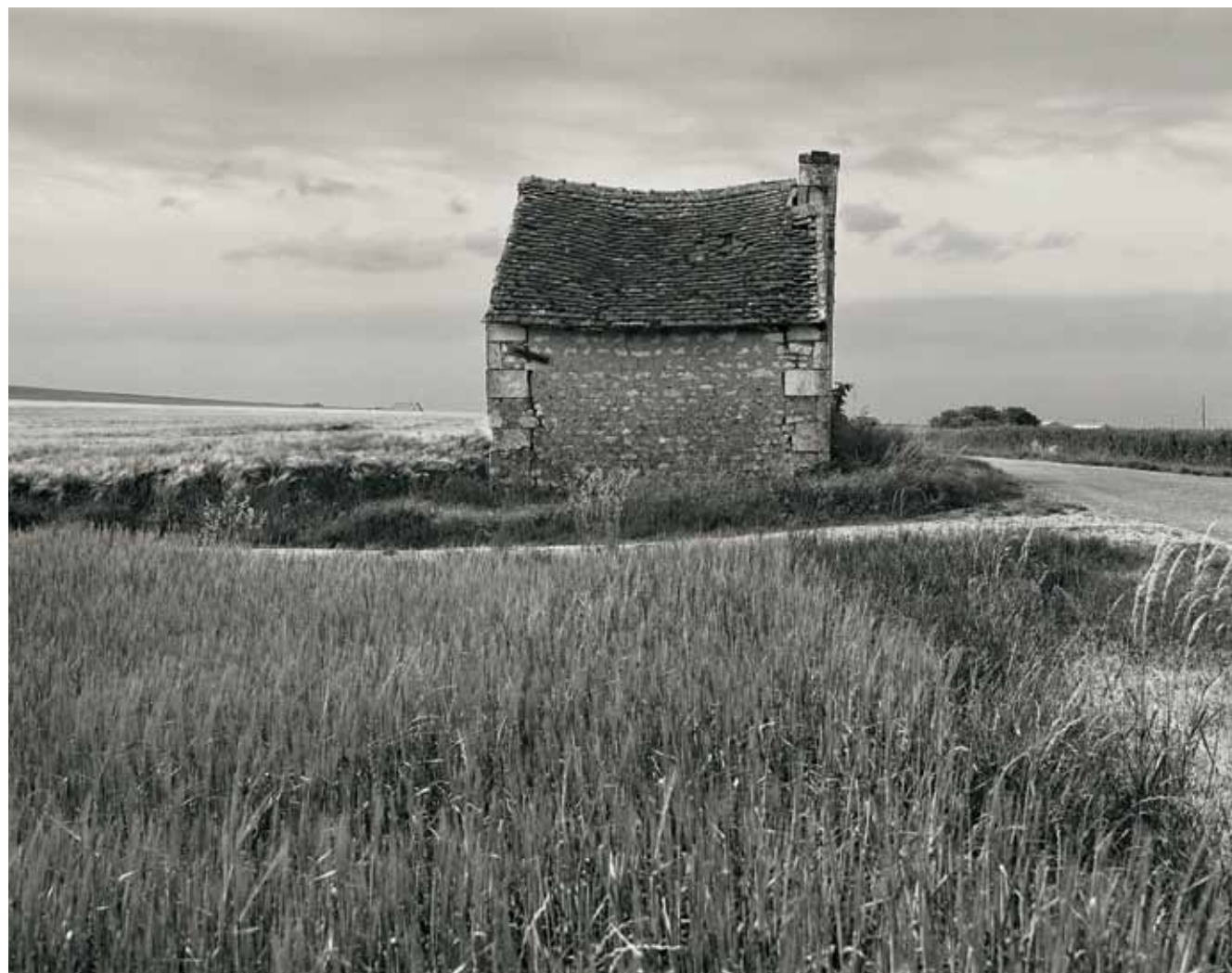
054 Loge de vigne à Theneuil. Indre-et-Loire MARIUSZ HERMANOWICZ