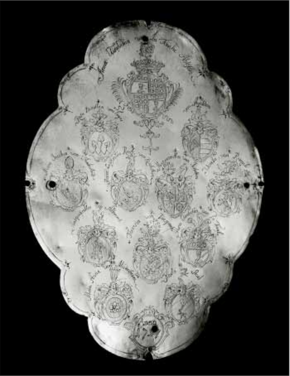
| 29 & 30 THANN (68), OTT- MARSHEIM (68)