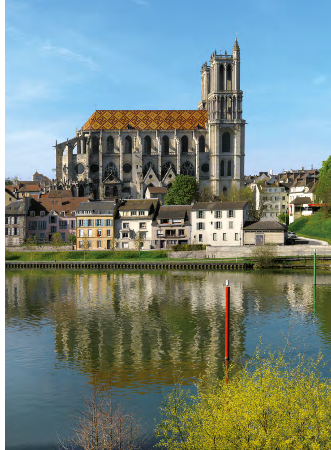
La collégiale de Mantes à l'élégante épure sans transept [classement M.H. 1840].

Il est impossible de chercher une influence commune à toutes les églises du territoire. D'une part parce que ce dernier se trouve à la confluence de trois diocèses, celui de Paris (Conflans-Sainte-Honorine et Andrésy), celui de Rouen au nord de la Seine et celui de Chartres au sud. D'autre part, parce que l'histoire de ces édifices est pluriséculaire et dépendante de la taille et de la richesse des communautés. Certes on trouve quelques récurrences comme les flèches de pierre qui